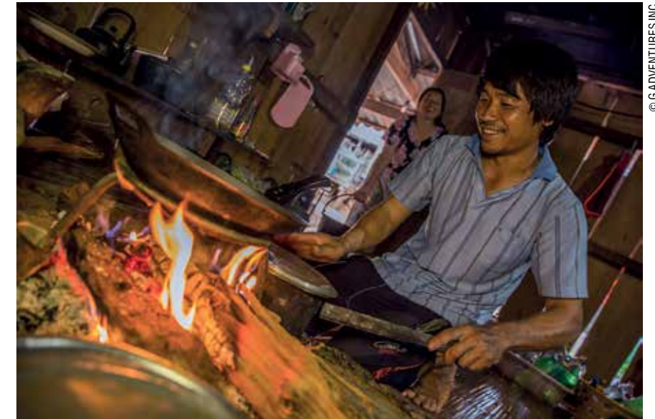
Μαγειρεύοντας με τους ντόπιους στο χωριό Pha Mon, στην Ταϊλάνδη. Στην απέναντι σελίδα: Το Μαλάουι στην Αφρική, ένας προορισμός που αξίζει να μπει στα ταξιδιωτικά πλάνα.

γκόμιου ΑΕΠ. Προβλέπεται ότι η Υποσαχάρια Αφρική θα περάσει ξανά σε ύφεση μετά από 25 χρόνια και ότι τα πράγματα στη Νοτιοανατολική Ασία θα είναι χειρότερα από ό,τι ήταν στα τέλη της δεκαετίας του 1970. Και οι άνθρωποι που θα πληγούν περισσότερο είναι εκείνοι που πιο πρόσφατα κατάφεραν να σκαρφαλώσουν πάνω από το όριο της φτώχειας, που επωφελήθηκαν από καλύτερη εκπαίδευση και περισσότερες ευκαιρίες για τις γυναίκες. Σύμφωνα με τα Ηνωμένα Έθνη, 210 εκατομμύρια άνθρωποι ανέβηκαν πάνω από το όριο της φτώχειας στην Ινδία μεταξύ του 2006 και του 2016, ενώ από το 2000 το 10% του πληθυσμού του Μπανγκλαντές κατέστη αυτοσυντηρούμενο – σε μεγάλο βαθμό γυναίκες. Στις Φιλιππίνες και στο Μεξικό, δύο χώρες που βασίζονται πολύ σε εμβάσματα από φίλους και συγγενείς που εργάζονται στο εξωτερικό – και πολύ συχνά στον κλάδο της φιλοξενίας – τα πράγματα αναμένεται να γίνουν πολύ χειρότερα, πολύ σύντομα.