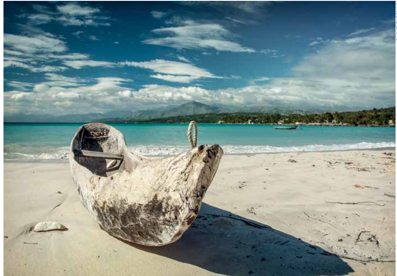
Περίεχνη βάρκα στην παραλία Port Salut, μία από τις δημοφιλέστερες της Αϊτής.

Το βέβαιο είναι ότι, καθώς το πρόγραμμά μου εξελισσόταν, κάθε φορά που έδινα μια συνέντευξη, η πρώτη ερώτηση ήταν για την πανδημία. Ήταν περίεργο. Η Αυστραλία είχε πέντε κρούσματα όταν έφτασα. Η Νέα Ζηλανδία είχε ένα. Δεν είχα την αίσθηση ότι μου διέφευγε κάτι σημαντικό, όπως π.χ. όταν