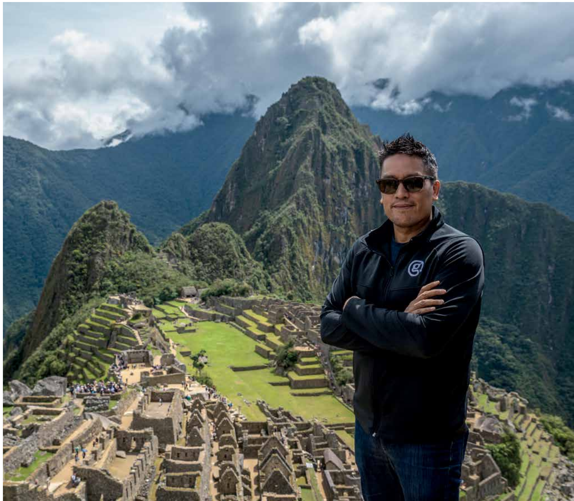
Ο Bruce Poon Tip στο Μάτσου Πίτσου, στο Περού.

Δεν χωράει αμφιβολία ότι το ταξίδι δεν θα είναι το ίδιο όταν βγούμε από την κρίση. Το ερώτημα είναι: Με τι θα μοιάζει την επόμενη μέρα; Θεωρώ ότι η γραμμή που χωρίζει την ελπίδα από τη σκληρή πραγματικότητα είναι πολύ λεπτή. Σίγουρα επίσης, αυτό που προσωπικά εύχομαι θα απέχει πολύ από το εφικτό. Έχουμε την ευκαιρία να μηδενίσουμε το κοντέρ, να κάνουμε μια νέα αρχή. Αυτό είναι το θέμα αυτού του Instabook. Είναι ένα βιβλίο για σένα, για μένα και για κάθε άλλο ταξιδιώτη της παγκόσμιας κοινότητας που θα έχει την ευκαιρία να αναθεωρήσει και να δώσει ένα νέο περιεχόμενο στην έννοια του «ταξιδεύω». Είναι ένα βιβλίο για το πώς το ταξίδι μπορεί να γίνει αυτό που θέλουμε την επόμενη μέρα.