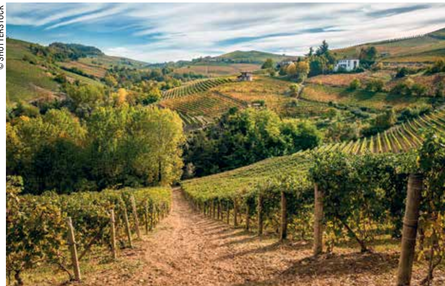
Οι αμπελώνες του Πιεμόντε, μια εναλλακτική πρόταση ταξιδιού.

Μπορείς να γνωρίσεις αντίστοιχες εμπειρίες –εννοώ, εντελώς διαφορετικές– στην Ταϊλάνδη και στην Κίνα, στην Αιθιοπία και στην Αργεντινή, στο Ομάν και στην Τουρκία. Πρέπει απλώς να είσαι ανοιχτός σε νέα ερεθίσματα και ερμηνείες, όπως ήμουν εγώ, σε ένα παλάτι στην Ινδία, σε ένα πολυτελές δείπνο, όπου όλοι έτρωγαν με τα χέρια. Μου πήρε λίγα λεπτά, αλλά έπιασα το νόημα, και τότε ο κόσμος μου έγινε λίγο μεγαλύτερος.