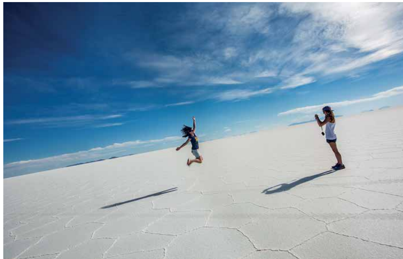
Ταξιδιώτες στις εντυπωσιακές αλυκές της Βολιβίας.