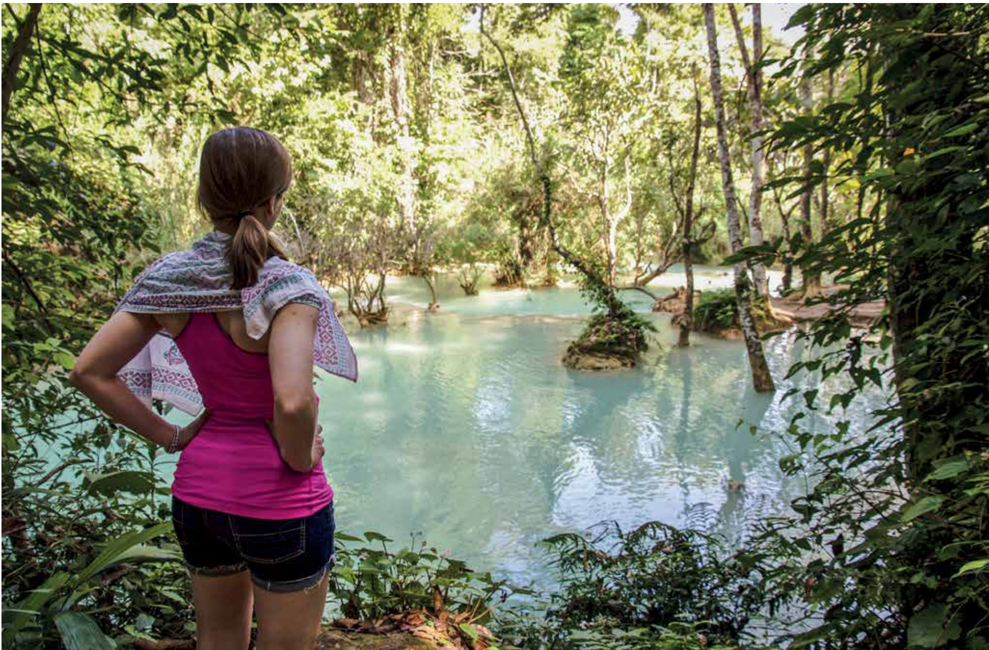
Στους καταρράκτες Kuang si, στο Λάος.

Όπως και τώρα, το περιβάλλον της «φυλακής» μου ήταν σχετικά ευχάριστο. Ένας πρώην πρωθυπουργός της Γαλλίας έμενε στο ξενοδοχείο μας, όπως και ο γιος ενός εκ των ιδρυτών του κορεατικού κολοσσού LG. Ήταν ωραίο ξενοδοχείο και το φαγητό καλό ήταν, μέχρι που άρχισε να τελειώνει. Ακόμα και η μοναδική φορά που κατάφερα να τρυπώσω ανάμεσα στα οδοφράγματα, έχοντας συμφωνήσει με έναν καταστηματάρχη να ανοίξει το μαγαζί του για να αγοράσω ένα ζευγάρι αθλητικά και ένα σορτσάκι για το γυμναστήριο, έκανε πιο έντονο αυτό που ζούσαμε: το αίσθημα ότι είσαι παγιδευμένος, την απώλεια της ελευθερίας. Ήμασαν παγιδευμένοι. Δεν ήμασαν σε φυλακή, και ειπ' ουδενί δεν μπορούν να ισχυριστώ ότι ξέρω πώς ζει ένας κατάδικος, αλλά πείστικα ότι όσα λέγονται για «χρυσά κελιά» που φιλοξενούν απασπασμένους του επιχειρηματικού κόσμου δεν αντιστοιχούν