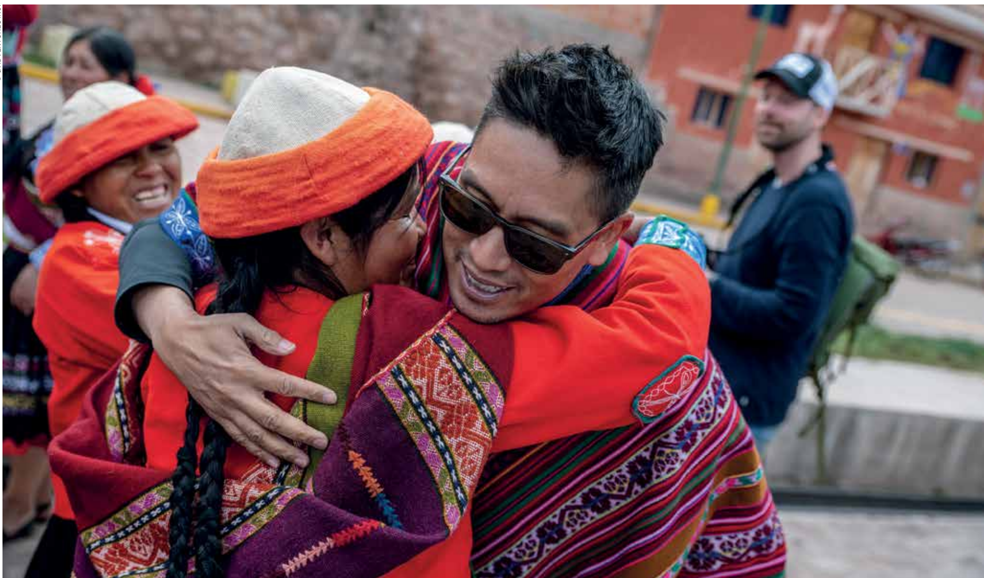
Ο Bruce Poon Tip με μέλη γυναικείου συνεταιρισμού στο Περού.

Τι θα συνέβαινε αν, στον απόηχο αυτής της πανδημίας, αρχίζαμε να αντιμετωπίζουμε τον κόσμο ως κάτι εύθραυστο; Ξέρουμε εδώ και καιρό ότι όντως είναι. Η κλιματική αλλαγή είναι αληθινή, το ίδιο και οι κοραλλιογενείς ύφαλοι που πεθαίνουν και τα «νησιά» από πλαστικά απόβλητα που επιπλέουν στους ωκεανούς. Αλλά ίσως να χρειαστεί κάτι όπως αυτή η κρίση, κάτι πιο προσωπικό, κάτι που γκρεμίζει τους δικούς μας προσωπικούς μικρόκοσμούς, για να το κωνέψουμε. Και τι θα συνέβαινε αν, εξαιτίας αυτού, αποφασίζαμε να ανοίξουμε τα φτερά μας λίγο περισσότερο, και για να δούμε μέρη του κόσμου όπου οι φίλοι μας και οι Ίνσταγκράμμερς που ακολουθούμε δεν έχουν δει, αλλά και για να αφήσουμε σε αυτά ένα πιο διακριτικό αποτύπωμα; Αυτό δεν σημαίνει μόνο να ταξιδέψουμε εκτός συνηθισμένων προορισμών, αλλά και να εξερευνήσουμε περισσότερο τους ήδη γνωστούς. Θες να πας στο Παρίσι; Φυσικά, και ποιος δεν θέλει. Αλλά πρέπει να βρεθείς στο ίδιο δωμάτιο με τη Μόνα Λίζα, έναν πίνακα που ξέρεις από νήπιο; Κάνε μια βόλτα στην Αριστερή Όχθη, ασφαλώς, αλλά μετά τραβήξου και στα πιο μακρινά διαμερίσματα, όπου παράγεται ο γαλλικός πολιτισμός του 21ου αιώνα. Πήγαινε στην Ιταλία, αλλά μίλησε και ανηφορίσεις προς το Πιεμόντε αντί της Τοσκάνης; Ή να προσπεράσεις το Κόμο και να δοκιμάσεις το Λέτσε; Καταλαβαίνετε τι εννοώ.