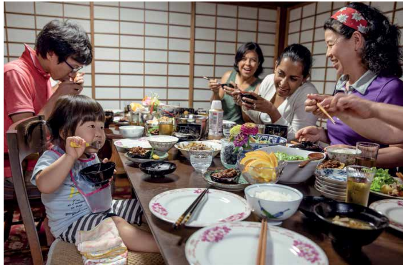
Γεύμα με ντόπιους σε σπίτι στην Ιαπωνία.

Τελικά, όμως, αυτό που καθιστά ιδανική μορφή τουρισμού τη φιλοξενία σε σπίτια είναι η επίδραση που έχω δει να έχει ξανά και ξανά στο Περου, στη Νικαράγουα, στο Νεπάλ, στις κοινότητες και στους νέους ανθρώπους. Η φι-