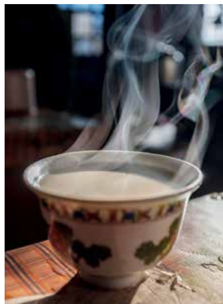
Το τσάι με βούτυρο από γάλα γιακ είναι το καλωσόρισμα στα σπίτια του Θιβέτ.

όπου εργάζονταν άνθρωποι που είχαμε βοηθήσει να σωθούν από τον δρόμο. Αυτό μας κόστισε, αλλά μας απέφερε και χρήματα. Πιστεύαμε από την αρχή ότι το να διακέεται ο πλούτος, αντί να συγκεντρώνεται, ήταν ένας καλός τρόπος όχι μόνο για να βγάλουμε κέρδος, αλλά και για να προσφέρουμε ελευθερία – όχι μόνο σε εμάς τους ίδιους, αλλά και σε όλα τα μέλη της κοινότητάς μας. Και τώρα μπορώ να κοιτάξω πίσω σε αυτή την πορεία τριάντα ετών και να δηλώσω κατηγορηματικά ότι υπάρχει άλλος τρόπος. Με το να προσλαμβάνεις ντόπιους αντί για «αλεξιπωτιστές», με το να μένεις σε ξενοδοχεία τοπικής ιδιοκτησίας (οικονομικά ή πολυτελή) ή με οικογένειες και να πληρώνεις για το προνόμιο της φιλοξενίας τους, με το να αγοράζεις ένα αναψυκτικό από τον τύπο με το καρτσάκι στον δρόμο και όχι από κάποια αλυσίδα, διασφαλίζεις ότι τα περισσότερα από τα δολάρια σου μένουν στις τσέπες των ανθρώπων που κάνουν το ταξίδι σου αξιομνημόνευτο. Αν εγώ έφτιαξα μια εταιρεία εκατομμυρίων βασιζόμενος σε αυτή την αρχή, εσείς μπορείτε να σχεδιάσετε ένα ταξίδι και όχι μόνο να το χαρείτε περισσότερο, αλλά και να επιστρέψετε ξέροντας ότι βοηθήσατε ώστε ο κόσμος να γίνει λίγο καλύτερος.