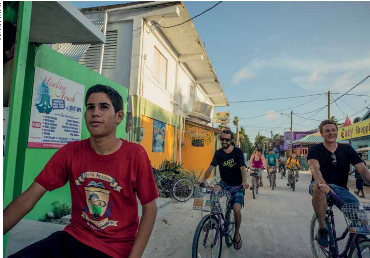
Ποδηλατική περιήγηση στην Μπελίτζ, στο πλαίσιο κοινωνικού προγράμματος του ιδρύματος Planeterra, που έχει συστήσει ο Bruce Poon Tip.

Μια ματιά σε τίτλους αμερικανικών εφημερίδων του Μεσοπολέμου για τις εξελίξεις στην Ισπανία και στη Γερμανία που συνέβαλαν στο να ριζώσει ο φασισμός αρκεί για να καταλάβεις πόσο σημαντικό είναι για τον ευρύ πληθυσμό να είναι εξοικειωμένοι με μέρη μακρινά, να είναι σε θέση να μην τα νιώθουν πλέον «ξένα». Η Γερμανία ίσως να μην είχε αιφνιδιαίσει την ανθρωπότητα, εάν, αντί για μερικούς ξένους ανταποκριτές—καθέναν με τις δικές του παρωπίδες—, ένα εκατομμύριο τουρίστες της μεσοιαίας τάξης