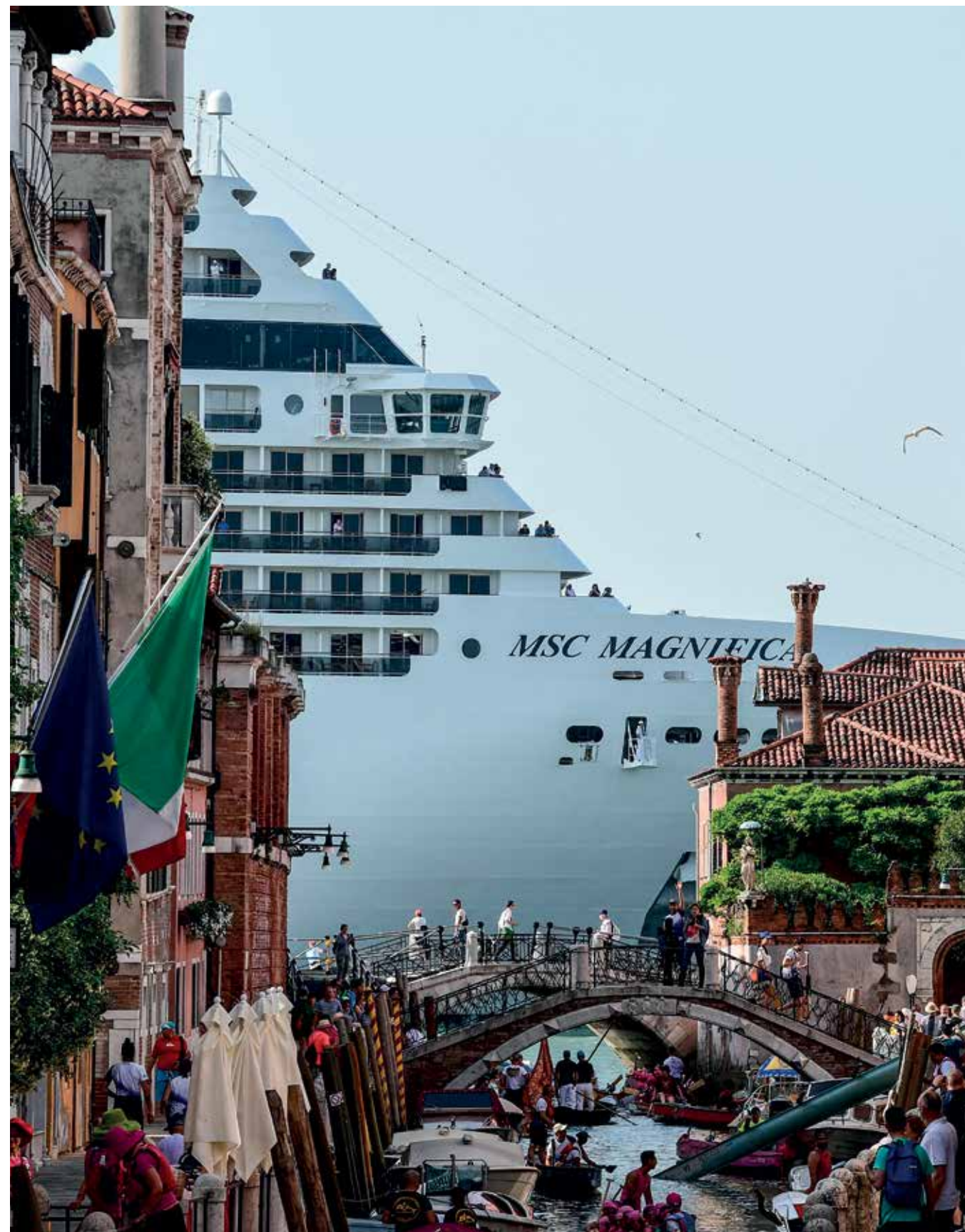
Προορισμοί όπως η Βενετία έχουν δει στην πράξη τις συνέπειες του μαζικού τουρισμού, με τον οποίο ταυτίζεται η κρουαζιέρα.

Αυτό που αναρωτιέμαι τώρα όμως είναι κατά πόσον, πριν κλείσουν την επόμενη κρουαζιέρα τους, μετά την πανδημία, οι ενδιαφερόμενοι θα θυμηθούν το «Diamond Princess», το κρουαζιερόπλοιο το οποίο είμαι σίγουρος ότι χρειάζεται μετονομασία. Στις αρχές της πανδημίας είχε περισσότερα κρούσματα –712– από όσα μετρούσαν χώρες ολόκληρες. Αναρωτιέμαι αν θα θυμούνται τι μας έμαθε για τους ιούς, τις επιφάνειες που αγγίζουμε και την αξία τού να κρατάμε αποστάσεις, εφόσον βέβαια έχουμε